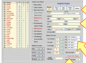
Modulo centrale Server