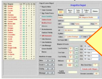
Modulo centrale PC/Server

Il modulo principale è installato sul Server che si trova presso il magazzino in rete locale o connessione ADSL. Il modulo di vendita è installato presso ogni punto vendita del negozio.